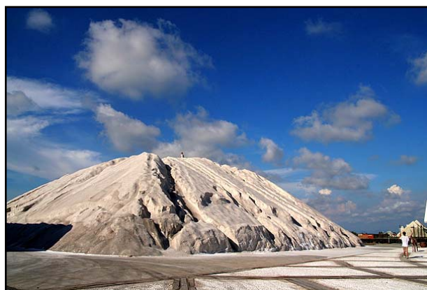
▲ 七股鹽田生態文化村一隅

臺南縣北門區由於地理位置處西南濱海環境，土壤鹽分高，農作物種植不易，造成當地居民生活