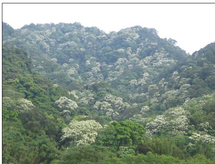
▲ 油桐花盛開布滿山頭的景象

苗栗縣油桐樹林立，主要分布於三義、銅鑼、大湖、南庄、公館等地山區，每年4、5月純白油桐花盛開，彷彿如飛雪片片，覆蓋山頭，美不勝收。油桐曾是客家庄重要的經濟作物，與客家庄有著密不可分的關係。油桐樹的種子可以採果榨油，煉製成桐油，桐油則可製作成防水、防腐的素材，其中揚名國際的美濃紙傘就是利用桐油當作傘面的防水油料；此外，桐油也是早期製作油漆的重要原料。由於科技的進步與生活結構轉變，油桐樹漸漸喪失其經濟價值，不過，每逢春天時油桐樹冒出桐花，繽紛繁盛，遠望如雪，因此，油桐花也替客家庄帶來了觀光價值，有「五月雪」之稱。