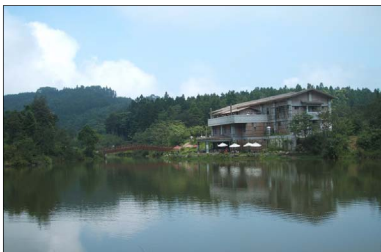
▲ 賽夏族聖地：南庄向天湖，圖右建築為「苗栗縣賽夏族民俗文物館」，典藏有賽夏族傳統文物和記載族群歷史

賽夏族是臺灣原住民族群中的少數民族，大多數居住在新竹五峰、苗栗南庄與獅潭境內。賽夏族人最重要且全國知名的重要祭典是 2 年一祭、10 年一大祭的巴斯達隘祭典，其起源自賽夏族的一個古老傳說，主要是用來祭祀曾經協助過他們的矮人靈魂。